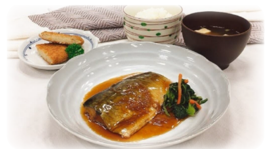
管理栄養士監修のお食事