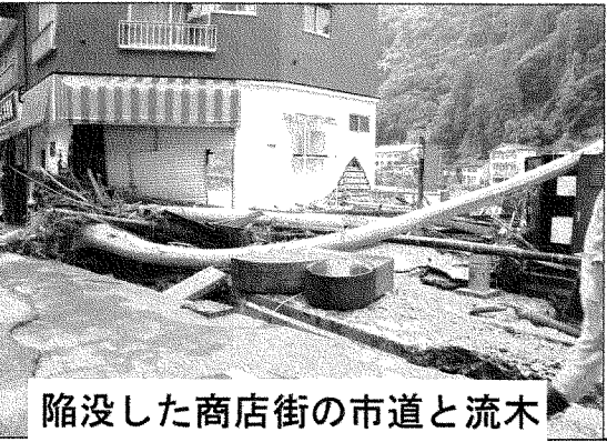
陥没した商店街の市道と流木