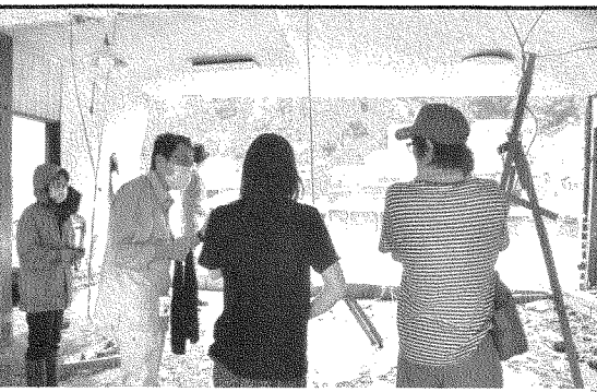
被災状況を聞く田村衆議院議員と県議