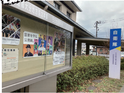
自衛隊大分地方協力本部日田地域事務所